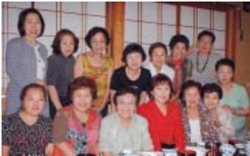
<ハーヴェストクラブ鬼怒川にて>

最初に、今年7月に行かれたニューヨーク視察を通して流通業界から見る社会状況を話された。4年前に行ったときに比べ、あまり変化は無く、むしろ日本のほうが進んでいる感じがしたという。日本の流通業界における消費額は昨年割れが36ヶ月続いており、同社も平成11年から13年の